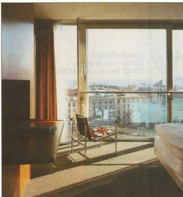
LUMINOSITÉ «Le dispositif permet de réaliser, pour chaque chambre, un seul pan vitré, celui du paysage urbain, face au lit et au vitrage translucide de la salle de bains.»

En 1996, il ne répond plus ni aux normes de sa catégorie****, ni aux enjeux de densification de la ville. Le projet déplace le noyau distributif et ajoute 60 chambres supplémentaires ainsi qu'une salle de petit-déjeuner panoramique à la transformation des 100 chambres existantes. L'architecture de pierre des façades est restaurée, et l'ossature métallique de sa structure est prolongée sur trois niveaux. La nouvelle enveloppe est alors suspendue à des colonnes métalliques d'un diamètre de 120 mm, sur 12 mètres de hauteur. Ce dispositif acrobatique permet de réaliser, pour chaque chambre, un seul pan vitré, celui du paysage urbain, face au lit et au vitrage translucide de la salle de bains.»