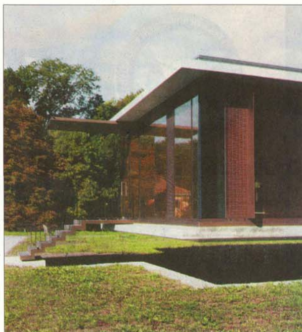
DISCRETION «Les espaces rayonnent autour de deux murs centraux, qui agissent en tant que poutres et portent - au sens propre - le poids des livres.»

«La bibliothèque accueille la collection de livres de droit du legs Fleuret. Les espaces rayonnent autour de deux murs centraux, qui agissent en tant que poutres et portent - au sens propre - le poids des livres. L'ensemble de l'édifice peut dès lors se projeter en porte-à-faux au-dessus de quatre murs pilotis, qui s'ancrent profondément sous les terres alluvionnaires dans la roche du plateau. En outre, l'inertie des épaisses dalles précontraintes autorise le recours au rafraîchissement nocturne, lequel s'opère grâce à l'ouverture de volets verticaux qui profitent de la ventilation naturelle. Enfin, l'emploi de nattes de lamelles de cuivre trempées, à la fois noyées à l'intérieur des verres et coulissant devant les vitrages, agit comme protection solaire et imprime un masque doré à la peau du bâtiment, avec des reflets moirés.»