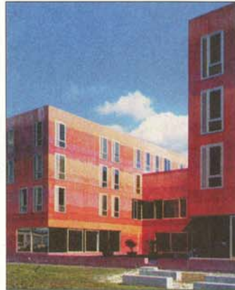
COULEURS «La masse est rouge et, simultanément, muette. Elle identifie l'institution, sans autre, dans la ville grise.»

Vagues, ébouriffements et taches brouillent l'exécution si soignée de la main du maçon. Il en résulte une sorte de pierre sculptée à angle droit, dont la douceur mate de la laiteuse alterne avec la brillance des