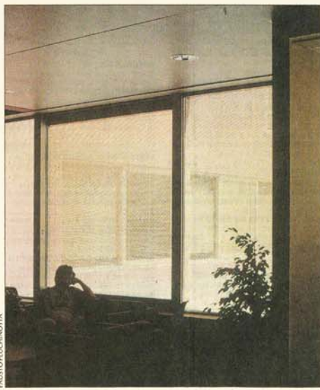
Chambre de patient du Centre de psychiatrie du Nord vaudois à Yverdon-les-Bains.